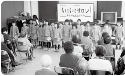
園児の歌声を披露

そして、この取組を通して生まれた地域住民同士のきずなが、いざという時の支えあい活動にもつながっています。