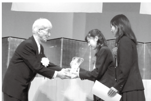
三島高等学校ウオランタス同好会