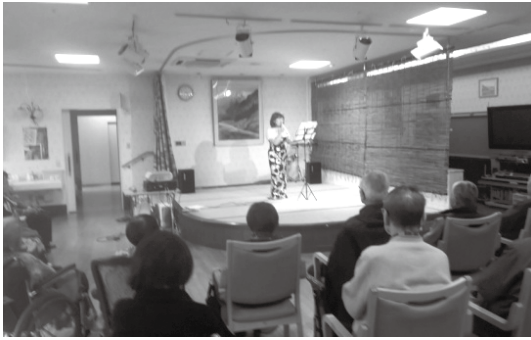
懐かしい歌に聞き入る