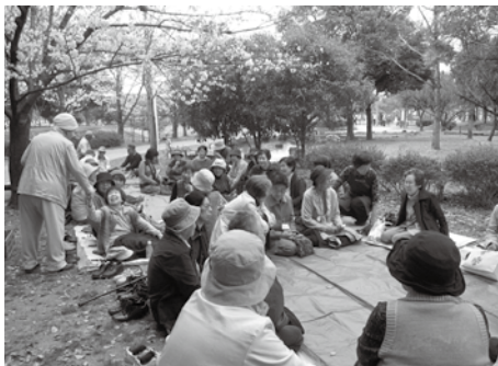
お花見で楽しいひととき

「子ども達に負けないようにいつまでも元気になりたい」という思いが芽生えたり、お互いが知り合い、顔の見える関係づくりを築くことが、