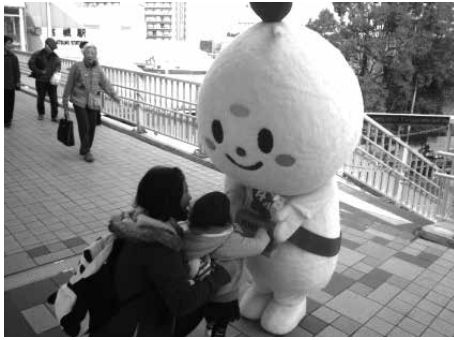
タッピーも募金活動中！

毎年、市民の皆さまに協力いただいている赤い羽根共同募金（10月1日～12月31日）と歳末たすけあい運動（11月20日～12月20日）を昨年にも実施しました。今年も自治会・法人の皆さまからの募金、10月3日・12月1日の街頭募金活動でボランティア活動や募金をしてくださった方など、多くのご支援をいただきました。 皆さまからいただいた募金は、地域の福祉活動への助成、災害時の準備金として積み立てられています。ありがとうございます。