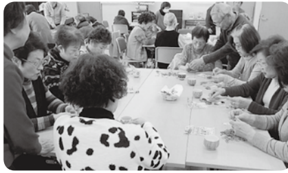
みんなで楽しく作品づくり