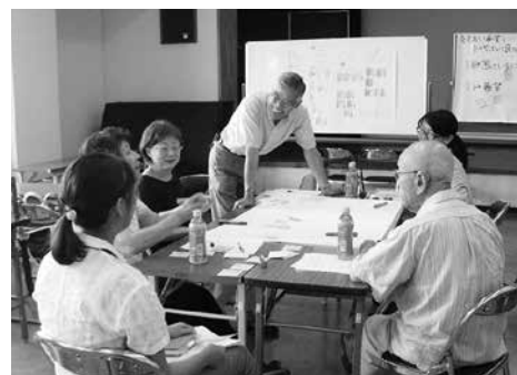
地域の見守り体制を検討