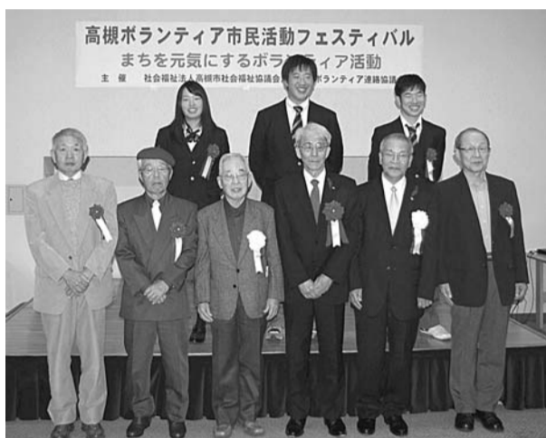
平成25年度ハートフル大賞受賞のみなさん

復興支援チャリティコンサート活動、途上国への井戸づくり支援。 第2部は、長年にわたる活動を続けているボランティア4団体によるシンポジウムを開催。各団体の活動現況、新たなボランティアニーズに対する