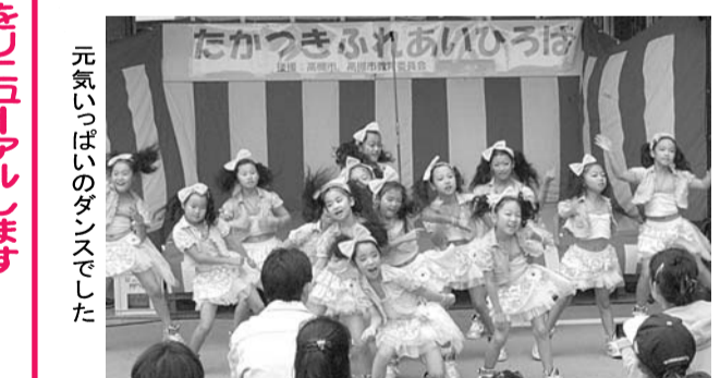
元気いっぱいダンスでした

イベントスペースでは、「マスマタンスクール」の子ども達によるダンスが披露され、会場はリズムと活気に包まれました。 この日の福祉バザーの売上金は50万4795円。そのうち13万5千円を「2013年フィリピン台風救援金」として日本赤十字社を通じておくりました。 また、31万64