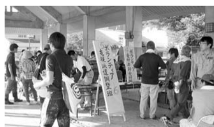
昨年京都府福知山市で設置された災害ボランティアセンターの受付風景

この災害ボランティアセンターは、市地域防災計画にもとづき、災害対策本部ボランティア対策部の統括の下に、市社協が中心となり、日本赤十字社大阪府支部高槻市地区や各団体と連携し設置するものです。