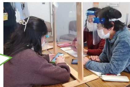
昨年度のスマホ講座の様子↑

Wi-Fiへの接続やメッセージアプリの「LINE」等、スマホを活用したコミュニケーションを中心に、実践的な講座を行う予定です。 地域の大学生が中心となり、講座を進めます。