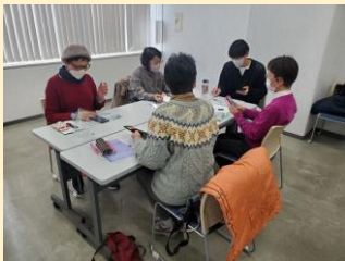
昨年度の講座参加時の様子

Mさん：身についたことを少しでも初心者の方に教えられたらと思ったからです。それに自分も勉強となり、自分の為にもなると思ったからです。