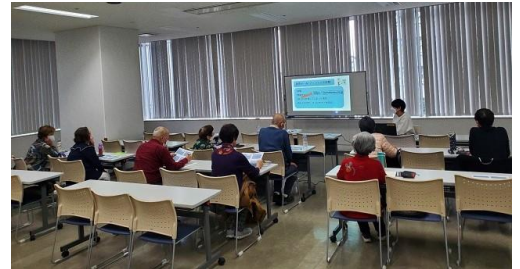
令和4年度ICT講座の様子

卒業生は現在各すこやかテラス（老人福祉センター）で実施しているスマートフォン講座のボランティアとして活動したり、身近な方にスマホの使い方を教えたり、卒業生が集まる交流会で情報交換を行う等、意欲的に活動されています。